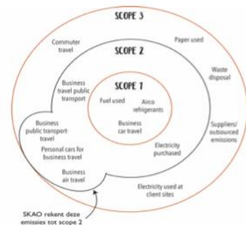
Verdeling CO 2 -uitstoot Pauw Dodewaard 2018